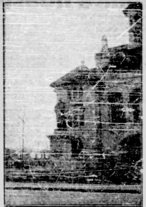
Constanța (Primăria și Statuia lui Ovidiu)

Citiți și răspândiți ziarul „Dobrogea Jună”