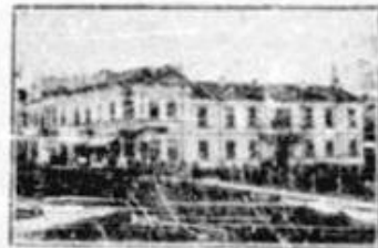
Un colț din Constantza