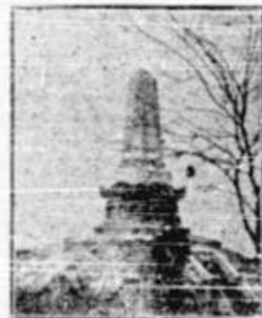
Monumentul Eroilor francezi-Constantza